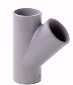
Trójnik 45° PVC-C